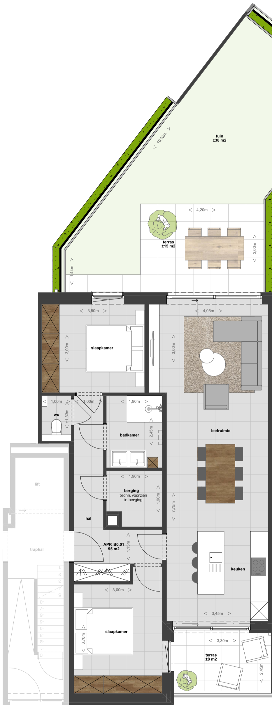
GELIJKVLOERS variante (wordt niet standaard uitgevoerd)